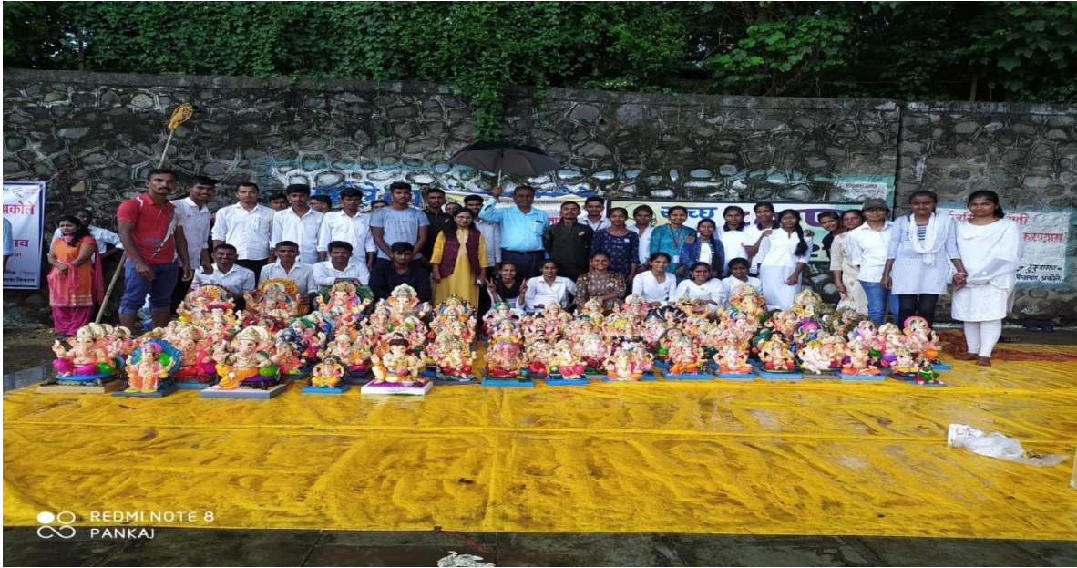
NSS Team with adopted idols of Shri Ganpati